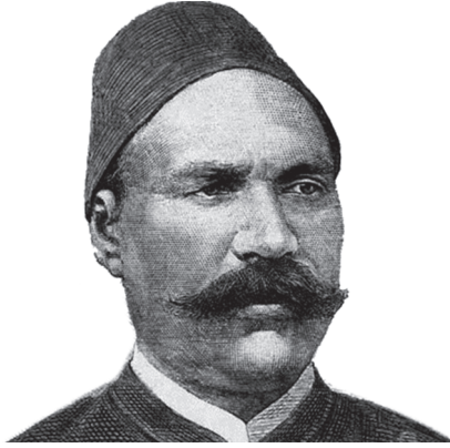
أحمد عرابي باشا.

وقد لبث «عرابي» تسع عشرة سنة في رتبة القائم مقام، ووصل إليه الظلم حيث كان كلما تطلع إلى الإنصاف والمساواة. ومن ذلك أنه حرم نصيبه من الأرض التي أمر الخديو إسماعيل بتوزيعها على الضباط في إقليم الغربية وإقليم المنوفية. وكان الخديو قد دعا ضباط الجيش إلى وليمة عامة ثم أعلن بعد الفراغ من تناول الطعام أنه قد أنعم على كل واحد من الباشوات بخمسمائة فدان، وكل واحد من أمراء الأليات بمائتي فدان، وكل قائم مقام بمائة وخمسين فداناً من زيادة المساحة.